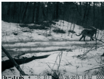
Рисунок 1. Кл. Ламазина (фото сделаны фотоловушками ИПЭЭ и им. А.Н. Северцова РАН) фотоловушки марки Bushnell, Правый Тигровый (фотоловушка марки Bestok LTL-8210A)

С помощью автоматических фотоловушек можно с высокой степенью достоверности определить количество особей, исключив повторный учёт животных на сопредельных территориях. Именно фотомониторинг позволяет получать данные круглогодично, независимо от погодных условий.